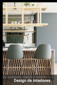
Design de Interiores