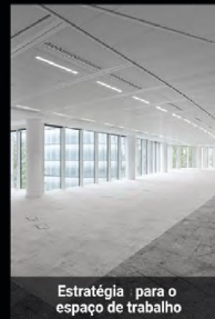
Estratégia para o espaço de trabalho