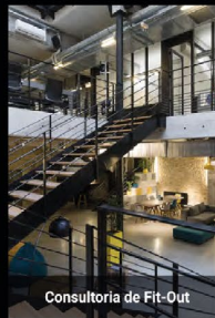
Consultoria de Fit-Out