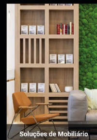
Soluções de Mobiliário