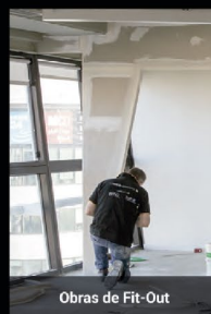
Obras de Fit-Out