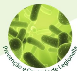
Prevenção e Controlo de Legionella