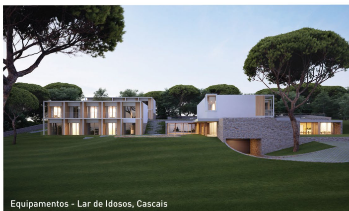
Equipamentos - Lar de Idosos, Cascais