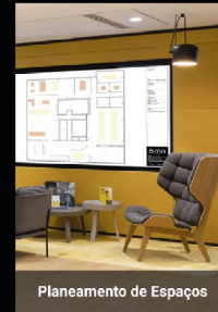
Planeamento de Espaços