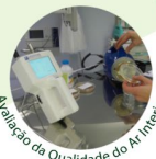
Avaliação da Qualidade do Ar Interior