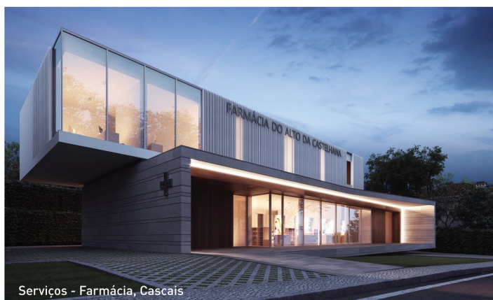
Serviços - Farmácia, Cascais

ESTUDO DE NECESSIDADES • ELABORAÇÃO DE PROJECTOS RELACIONAMENTO COM ENTIDADES LICENCIAMENTOS • CERTIFICAÇÕES • CONSTRUÇÃO